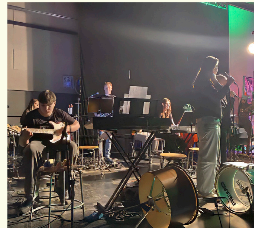
Musikgruppen bestående af elever fra 8. årgang, sørgede for stemning, energi og levende musik under årets skuespil på Hvinningsdalskolen.

- Det var lidt stressende i starten, fordi vi skulle lære alle sangene, og fordi der var mange at lære, men så blev det ret sjovt.