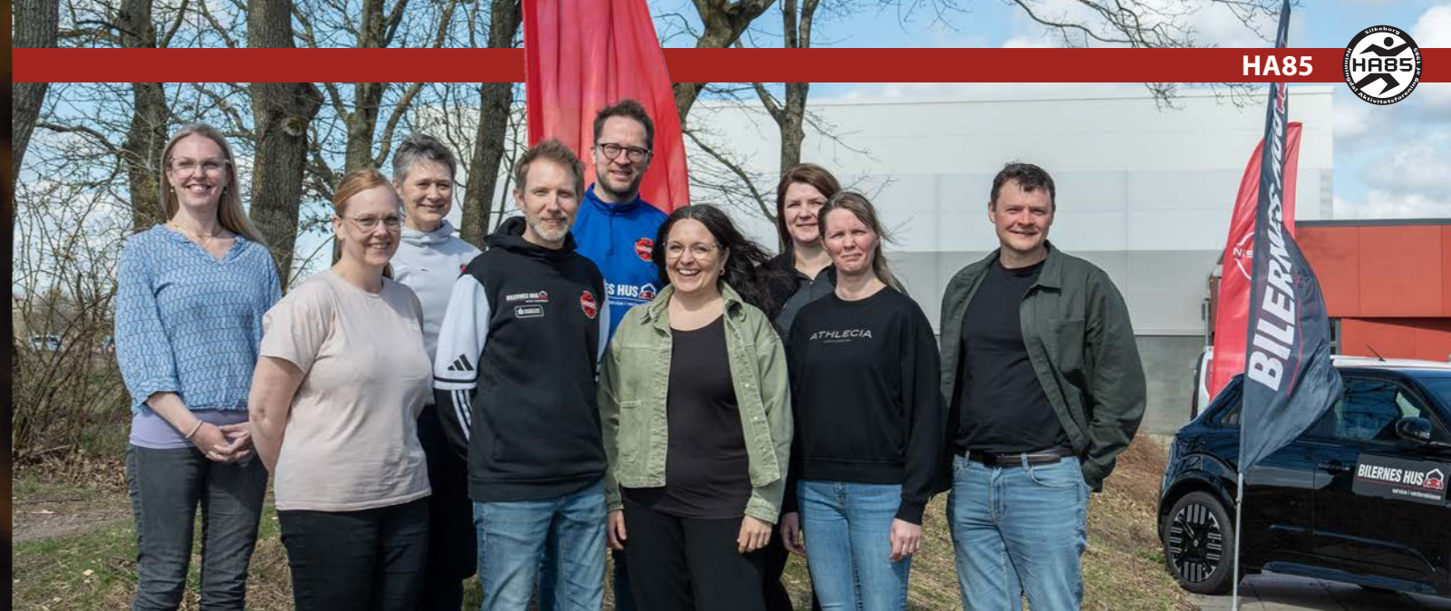
På mødet i Hvinningdal underskrev repræsentanter fra hovedbestyrelserne i HA85 og Snedsted SGIF den nye venskabsklub-aftale, som skal styrke samarbejde, videndeling og fællesskab mellem de to foreninger.