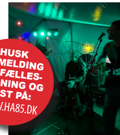
Om aftenen på HvinningdalDagen åbnes det store telt med lækker buffet fra Madselskabet og fed live-musik leveret af bandet Festministeriet. Arrangementet om aftenen kræver forhåndstilmelding - det kan du finde på www.ha85.dk .

HUSK TILMELDING TIL FÆLLESSPISNING OG FEST PÅ: WWW.HA85.DK