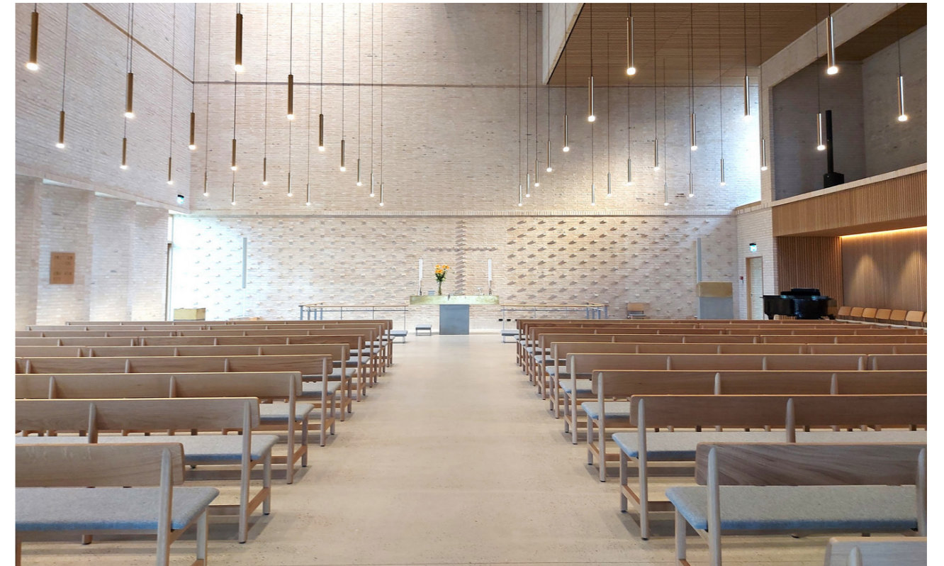
Det kommende orgel får sin plads højt i kirkerummet, hvor der allerede fra kirkens opførelse blev tænkt frem mod musik og fællessang i Hvinningdal Kirke.