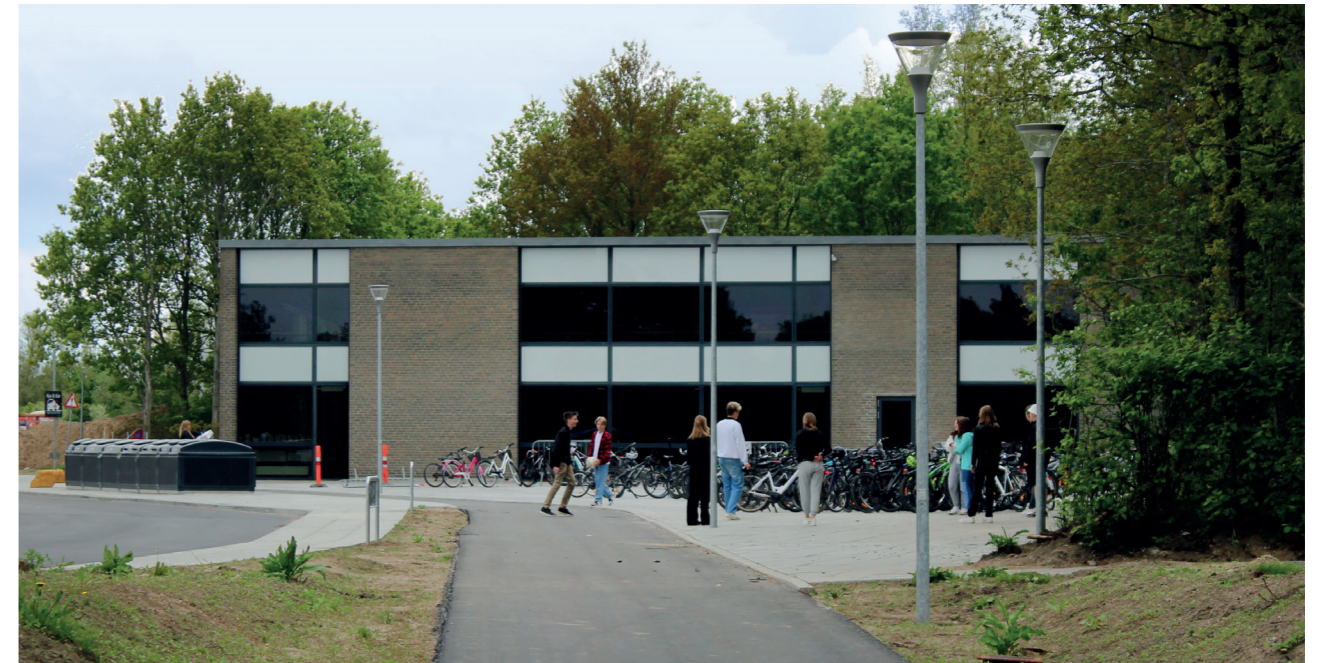
Fleere områder omkring skolen har fået et "facelift", men man er langt fra i mål. HA85 og skolen er, sammen med relevante folk fra Silkeborg kommune, gået i gang med at kigge på en "Helhedsplan" for udeområderne omkring "Den gamle kirke", idrætsfaciliteterne og skolen, således at der kan lægges én samlet ambitiøs plan som alle interessenter arbejder ud fra.