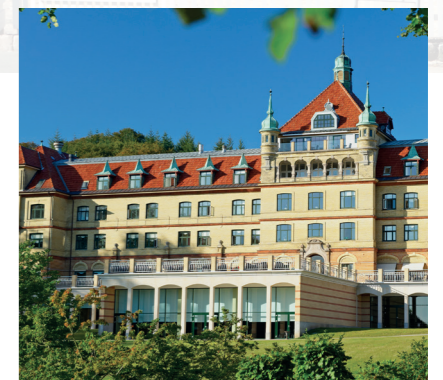
To eksempler på gode oplevelser: Øverst er det romantiske idyll hos Hotel Kirstine i hjertet af Næstved, et perfekt udgangspunkt for udforskning af den sjællandske købstad. Og herover ses Hotel Vejlefjord Kur & Spa, hvor man kan opleve wellness i verdensklasse.

For de traditionelle landevejskroer var beliggenheden alfa og omega, og tilgængeligheden og beliggenheden vægter stadig højt hos Small Danish Hotels. Med kort afstand til skov og strand udgør de fleste af vores overnatningssteder et behageligt udgangspunkt for aktive og naturglade gæster, der gearer ned med en golfkølle i hånden, med slentreture på stranden eller på den tohjulede med el- eller rugbrødsmotor. Samti-