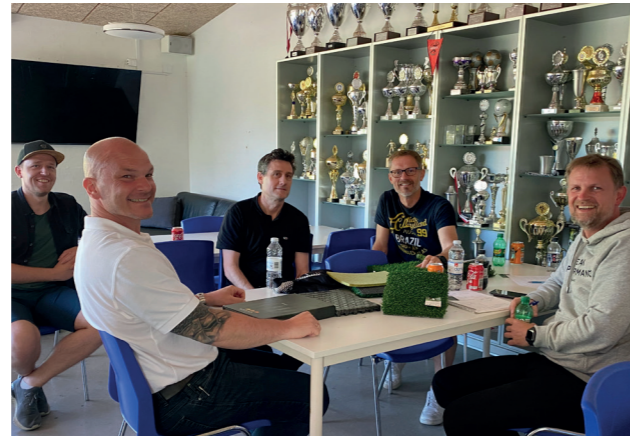
Behovet for en kunstgræsbane i nærområdet i Hvinningdal er stort og brugerne vil blive mange: Skolen og de mange daginstitutioner i dagtimerne, og medlemmerne i HA85 og FC Silkeborg om eftermiddagen, aftenen og i weekenden. En arbejdsgruppe er nedsat og igang.