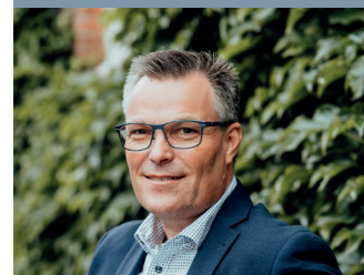
Frank Lerche Ejendomsmægler / Valuar