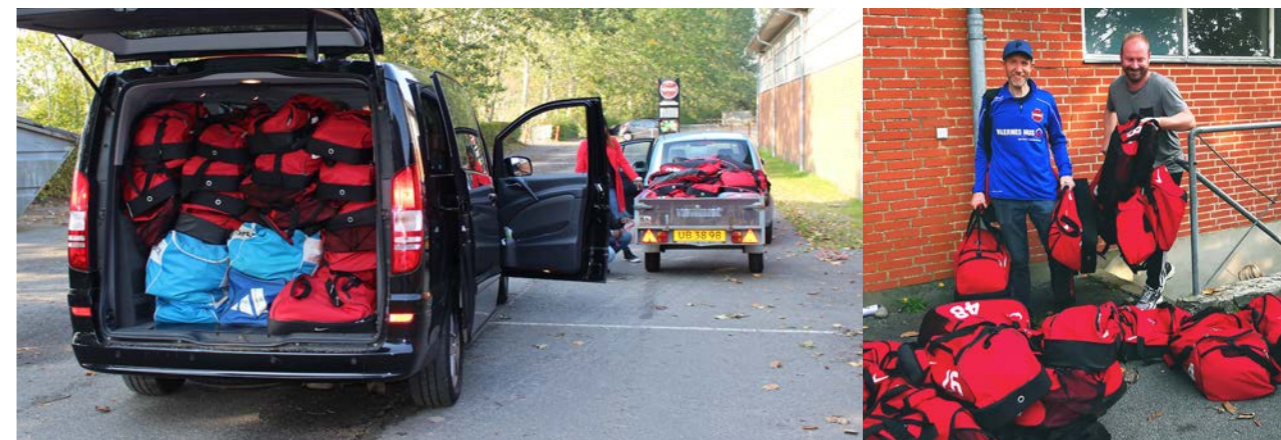
Udover de mange sæt spillertøj som blev fundet frem fra kælderens, var donationen suppleret af sportstøj og fodboldstøvler fra HA85' medlemmer. Den store mængde udstyr blev i september hentet i Hvinningdal, hvorefter det omlastes til en container mod Gambia.