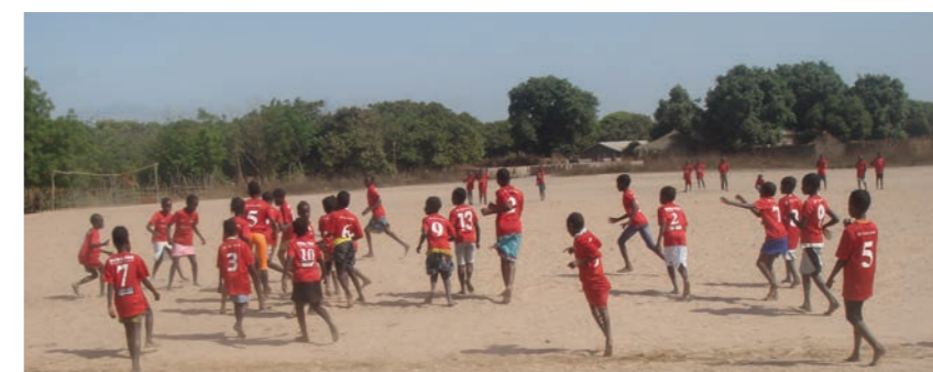
Donation fra i 2014, muliggjorde at man kunne organisere skolefodbold, samt etablere fodboldturneringen YaSally Cup for alle landsbyerne i distriktet.

- Det er udelukkende på baggrund af jer, HA85's store donation i 2014, at vi fik mulighed for at etablere den meget succesfulde fodbold-