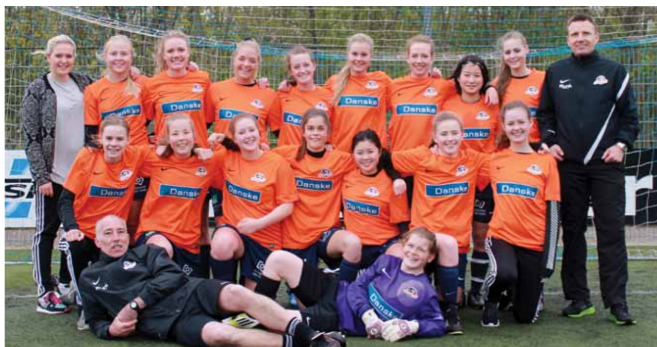
FC Silkeborg U19 pigerne

U19 drengene skulle prøve kræfter med hold fra Holland, Belgien og Frankrig (1-0, 0-1 og 3-0) hvilket gav holdet mulighed for at spille sig i søndagens finale.