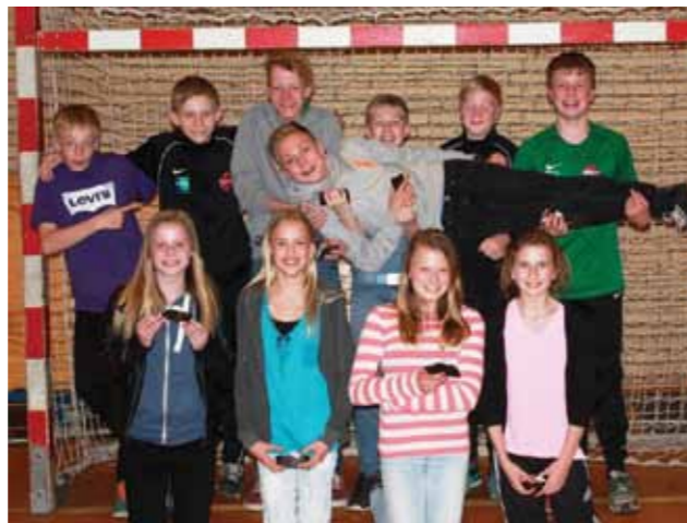
De unge hjælpere fik en gave ved afslutningsmødet som tak for indsatsen med klubbens yngre hold.