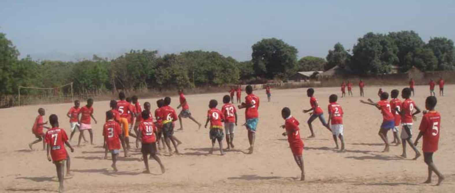
En støtte fra vores lokalområde og klub, som ikke betyder meget for os økonomisk, men hjælpen gør en enorm forskel i flere områder i Gambia.