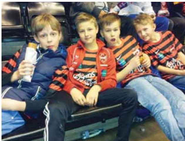
U10 drenge til CHL. kamp mellem FC Midtjylland og WHC Varder.