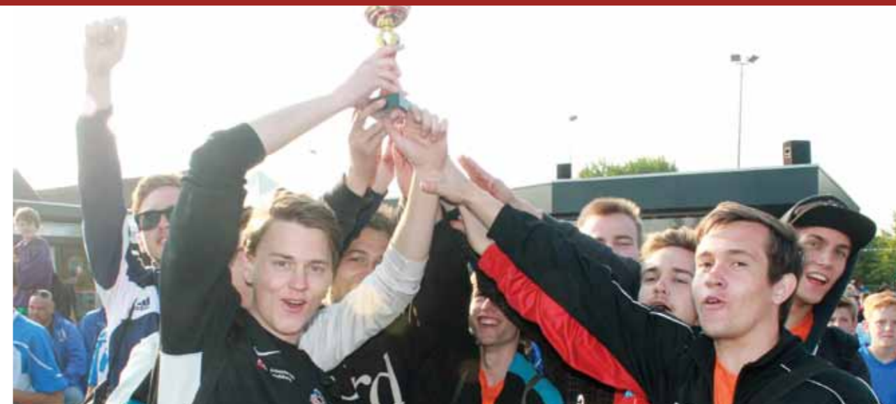
U19 drengene vandt bronze i Holland

Søndag kunne alle sove lidt længere, da vi først tog afsted fra skolen kl. 10, og blev fordelt ud på 3 forskellige anlæg som alle var meget lækre. Pigernes anlæg var hos ASC Waterwijk, hvor man kunne følge seks 11-mandskampe fra deres tårn af et klubhus, hvoraf 3 kunstbaner var en del af dette. U17 drengene skulle igen tilbage til FC Almere, der råder over syv 11-mandsbaner, hvoraf de tre baner også var kunstbaner.