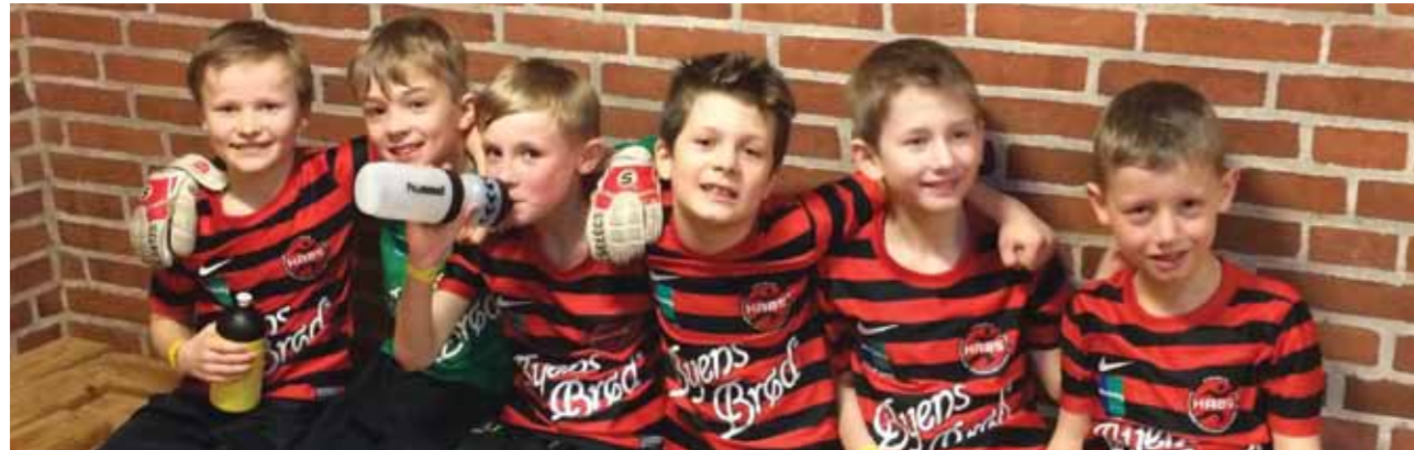
Af Michael Steinicke

Efter en god indsats i indendørs fodbold DGI pulje 11 før jul, kvalificerede HA85 U9 drengene sig, for første gang, til Landsmesterskabet.