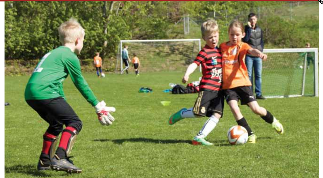
Der blev fightet på sportsanlægget i Hvinningdal til årets Kom-I-Form stævne.