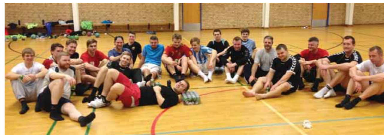
Spredt både aldersmæssigt og håndboldmæssigt. Men én ting har håndboldherrene til fælles: De giver den MAX gas fra start til slut!

I starten af sæson 2 var vi faktisk lige ved at vinde Fregat Cup i Ebeltoft - ups... Vi spillede nogle gode kampe, og bankede bl.a. et lokalt Serie 1 tophold, der var noget fortørnet